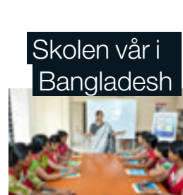
Skolen vår i Bangladesh

Friendly symboliserer KappAhls relasjoner gjennom hele kjeden. Vi arbeider for bedre forhold for alle menneskene og samfunnene som bidrar til vår virksomhet.