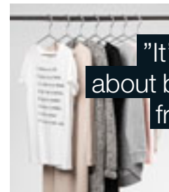
"It's all about being friendly"

Fashion symboliserar hållbarhetsarbetet med våra produkter. Vår egen design bidrar till att utveckla våra produkter för bästa resursanvändning och materialval.