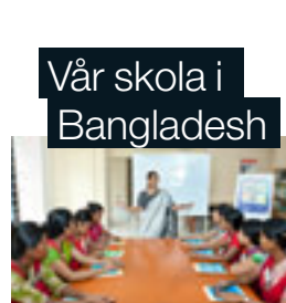
Vår skola i Bangladesh

Friendly symboliserar KappAhls relationer genom hela kedjan. Vi arbetar för bättre förhållanden för alla de människor och samhällen som bidrar till vår verksamhet.